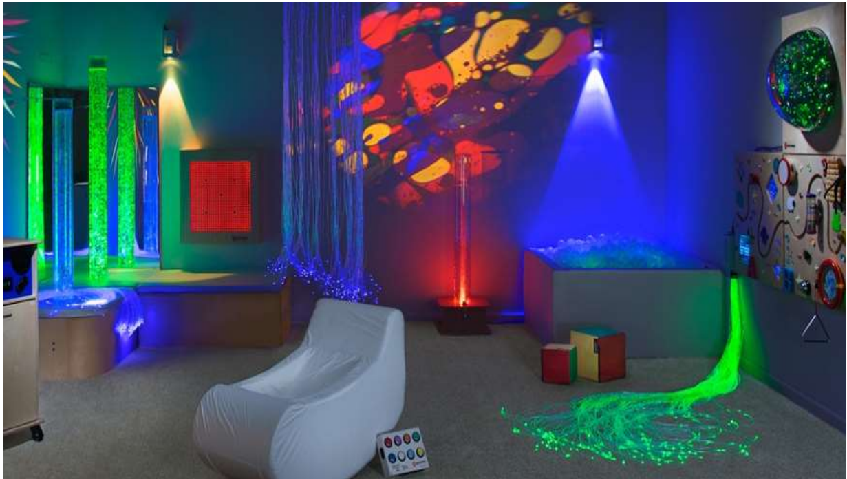
primer multisenzorne sobe

Pravilna uporaba multisenzorne sobe prinaša številne koristne učinke, saj izboljšuje razpoloženje, pozornost in koncentracijo otrok in mladostnikov, zmanjšuje vedenjske težave in dviguje motivacijo za šolsko delo. Ob pravilni uporabi in s pomočjo terapevtov se lahko uporablja individualno, v paru ali manjših skupinah.